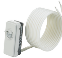
LRM8119/00 Lum Based Ext Sensor with LCA8004/00 COVER