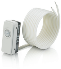
LRM8119/00 Lum Based Ext Sensor with LCA8004/00 COVER