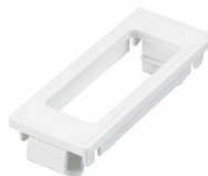
LRM8120/05 Lum Bas Ind Ext Sensor H513 N