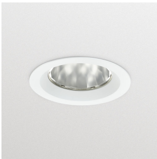
GreenSpace Accent Fixed