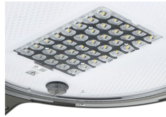
TownTune ASY BDP265