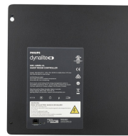
DRC-GRMS-UL General Room Relay Controller