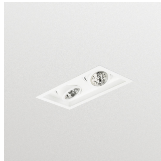
StoreFlux GD602B, module LED, avec collerette, version orientable