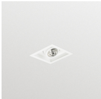
Encastré LED StoreFlux GD601B modulaire avec collerette